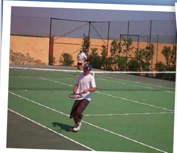
Pistas de tenis