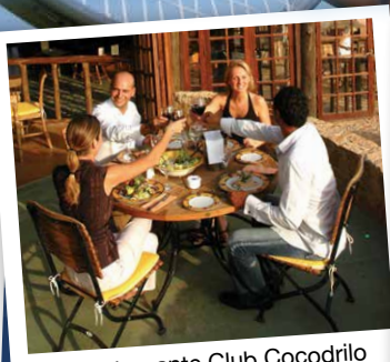
Restaurante Club Cocodrilo